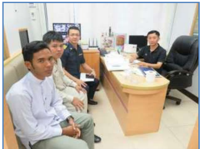
ธนาคารออมสิน