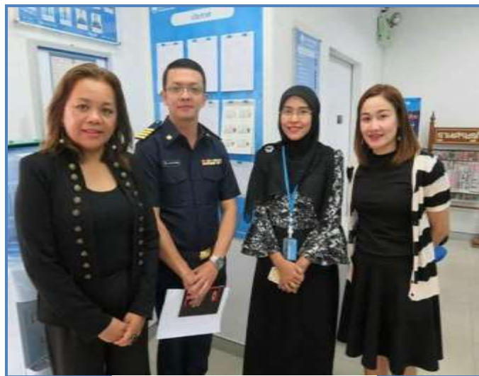
ธนาคารกรุงไทย จำกัด (มหาชน)

กิจกรรมที่ ๑๑ วันที่ ๒๘ สิงหาคม ๒๕๖๐ สำนักงาน คปภ.จังหวัดยะลา เข้าตรวจติดตามการเสนอขายผลิตภัณฑ์ประกันภัยผ่านธนาคารให้เป็นไปตามประกาศ คปภ. ของธนาคารกรุงไทย จำกัด (มหาชน) ธนาคารออมสิน ธนาคารอิสลาม ในพื้นที่อำเภอยะหา จังหวัดยะลา