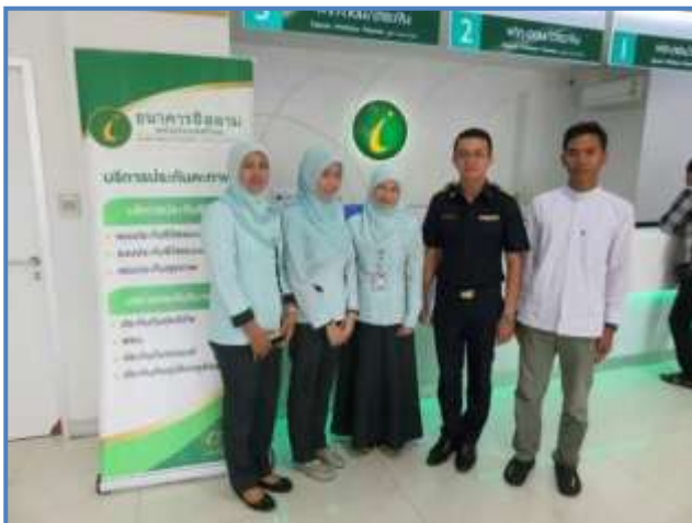
ธนาคารอิสลาม