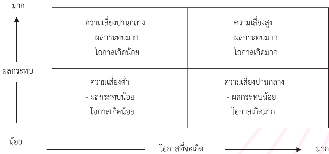
ภาพที่ 2.2 การประเมินความเสี่ยง

การประเมินความเสี่ยงถือว่าเป็นขั้นตอนที่สำคัญของการบริหารความเสี่ยงเพราะจะเป็นสิ่งที่ใช้ในการตัดสินใจว่าควรบริหารความเสี่ยงนั้นอย่างไร และควรให้ความสำคัญกับความเสี่ยงนั้นมากน้อยเท่าใด ความเสี่ยงใดที่มีความเสี่ยงสูงหรือมีความสำคัญมาก ผู้บริหารก็จะได้เร่งหาวิธีการป้องกันหรือควบคุมความเสี่ยงเพราะมีผลกระทบต่อองค์กรรุนแรงมาก