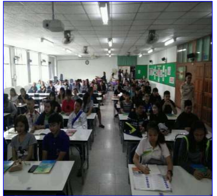
คปภ.คุ้มครองผู้ทำประกันภัย